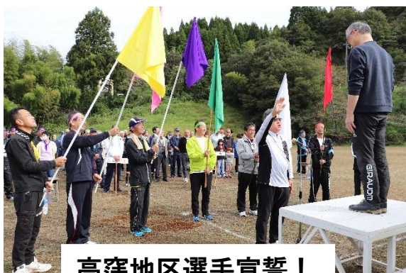
高窪地区選手宣誓！

地区運動会が4年ぶりに開催されました。久しぶりとあってみんな楽しそうに自分の集落の応援をしていました。開催にあたってご協力を頂いた役員の方々、地域の方々本当にありがとうございました。