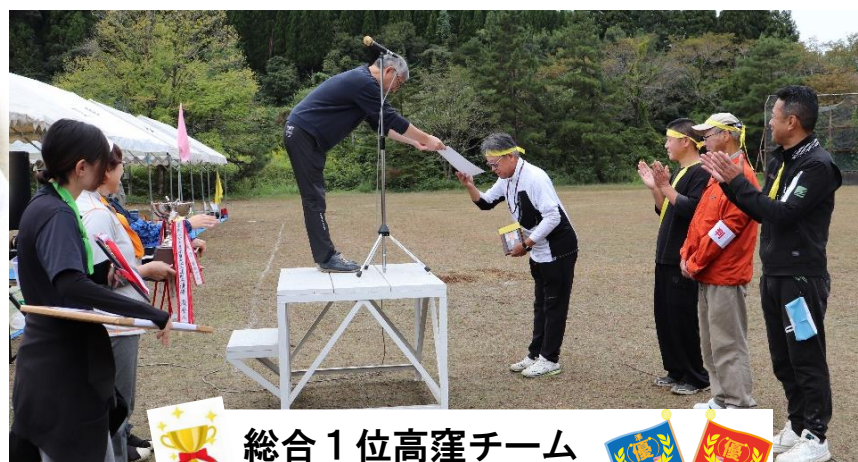
総合1位高窪チーム おめでとうございます。