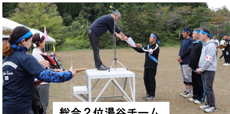
総合2位湯谷チーム