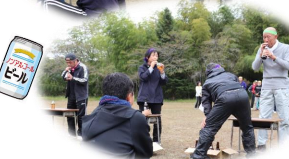
気分は五百万石レース