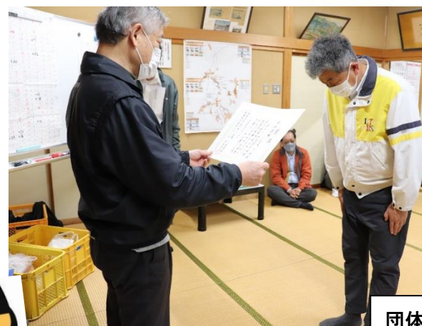
団体優勝 高窪チーム