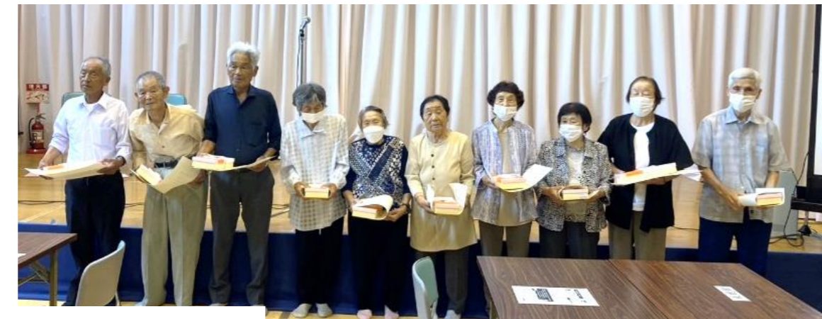
米寿の皆さんです