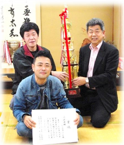
団体優勝 高窪チーム