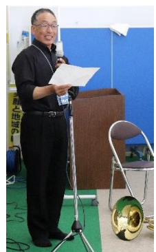
富山ホルニステン