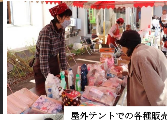
屋外テントでの各種販売