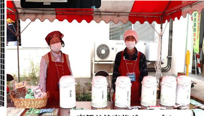
南蟹谷健康茶グループは9種類のお茶の試飲&販売