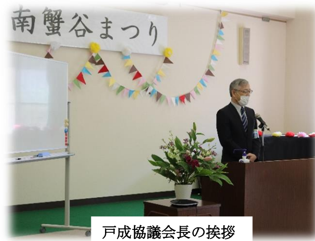
戸成協議会長の挨拶

◆南蟹谷まつり 10月18日(日) 南蟹谷交流センター 今年はいろいろな行事がコロナのため中止となりました。 それではあまりにも寂しい、ということで生涯学習・子育て支援部会や女性の会が中心となって企画。協議会や地区の皆さんのご理解、ご協力を得て開催させていただきました。 当日までどうなるのか不安でしたが、天気は快晴！たくさんの方々に来ていただきました。 無事に終わることが出来たのも地区の皆様、関係者の皆様のおかげです。 本当にありがとうございました。<m(_)_m>