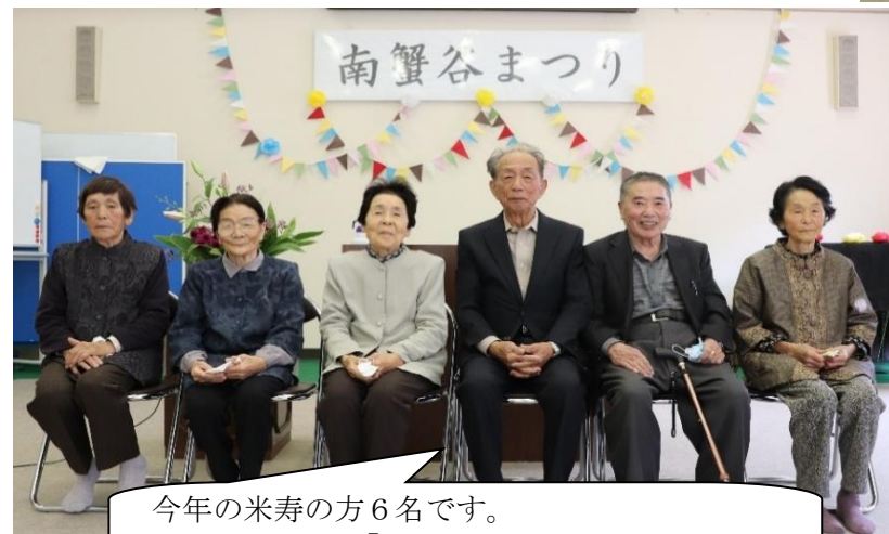
今年の米寿の方6名です。 全員で記念写真! いつまでもお元気で(^^)