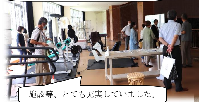
施設等、とても充実していました。