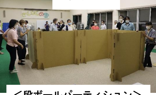
<段ボールパーティション>