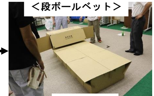
<段ボールベットの完成!>